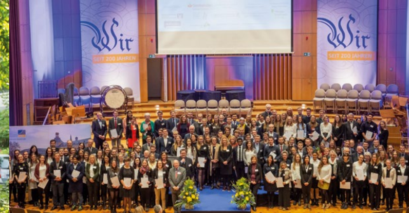
Stipendiaten und Förderer der Förderperiode 2018/2019

Mit der Unterstützung von Privatpersonen, Unternehmen und Stiftungen wird erreicht, dass sich leistungsstarke Studierende auf ihr Studium konzentrieren und somit ihr Potential ausschöpfen können.